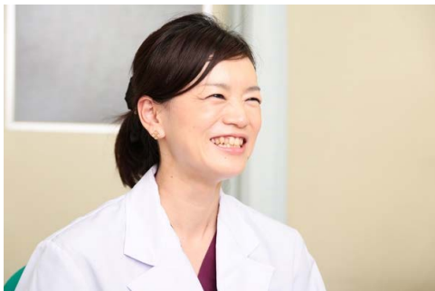
▲治療に内容についても優しい笑顔でわかりやすく説明している

A まずはお悩みの内容や症状についてしっかりお話を伺います。お腹やお尻を診察して原因を絞り込み、必要であれば血液検査やレントゲン検査なども行い、診断結果をご説明します。さらに内視鏡検査、大腸検査など精密検査が必要であれば、その日のうちに検査日の予約を入れることができます。医師・看護師などスタッフは女性ばかりで、診察室はとてもアットホームな雰囲気です。男性医師には言い出しにくかったことも、安心してお話しください。ただ、いくら女性同士でも、お尻を見せての診察は恥ずかしいとおっしゃる方もいらっしゃるので、診察は正確かつ素早く。リラックスして受けられるように工夫をしています。人は視線が合うと「恥ずかしい」と感じるので、壁側に顔が向くようにベッドに寝ていただき、おしゃべりをしている間に終わっているイメージです。実際に受診されると、「もっと早く来ればよかった」とおっしゃる方が多いです。