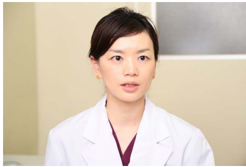
▲他科との連携も密に取れるというのが総合病院ならではの強み

器、充実のスタッフ体制が整っており、予防から最先端治療まで、継続的な健康管理ができることが大きなメリットです。万が一胃がん・大腸がんが見つかって、患者への負担が少ない腹腔鏡手術など、QOL（生活の質）まで考えた医療を提供します。開設してまだ日が浅いですが、痔の相談にいられて大腸がんが見つかった方もいらっしゃいます。病気の早期発見・早期治療のためにも、まずは気軽にご相談ください。