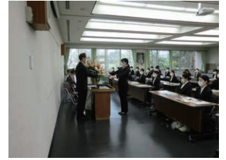
竹下病院長から辞令の交付

これから各部署で様々な研修を重ね、医療の現場を支える一員として成長していきます。新しい仲間とともに、より良い医療の提供を目指してまいります。皆様、よろしくお願いいたします。