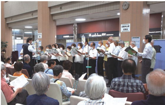
関中コーラス部の美しく力強いハーモニー

新型コロナの影響により中断していた「サマーコンサート」を、3年半ぶりに開催しました。以前より規模を縮小して感染対策に配慮しながらの開催ではありましたが、患者さんやご家族にご来場いただき、美しい音色や素晴らしい歌声に浸る夏の宵を過ごしていただきました。関中コーラス部の皆さんは、コロナ禍の中で満足な練習もままならない中、また歌声を披露できる日を迎えられ、溢れんばかりの温かい拍手をいただき、感激していました。