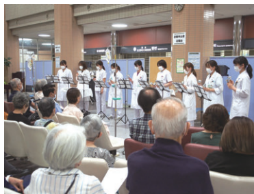
職員有志による 涼やかな音色のハンドベル