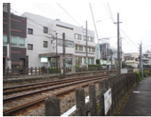
京王線・東急世田谷線 「下高井戸駅」徒歩1分

診療科目/内科、循環器内科、呼吸器内科、胃腸内科、肝臓内科、腎臓内科、糖尿病内科、神経内科、リウマチ科、人工透析内科、内視鏡内科、物忘れ治療、睡眠時無呼吸症候群、禁煙治療、ペースメーカー管理、骨粗鬆症、フットケア、不整脈