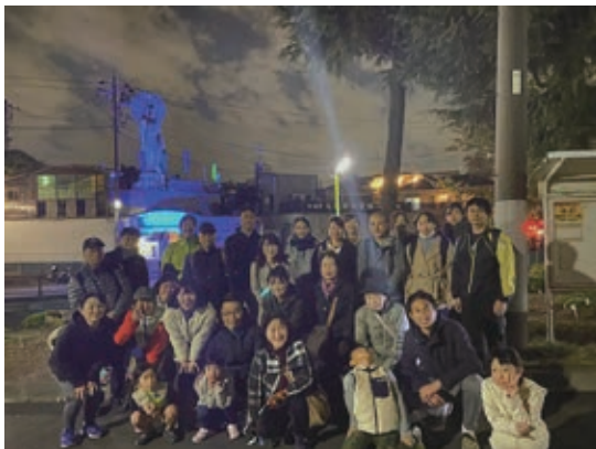
ライトアップした大佛の前で

たくさんの患者さんや医療スタッフへ、糖尿病について啓発する機会とすることができました。