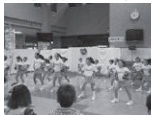
チアリーディング （YCC用賀チエリーズ）