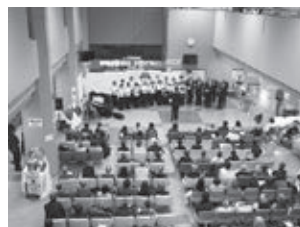
主催の関中コーラス部