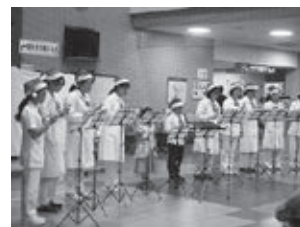
職員有志によるハンドベル