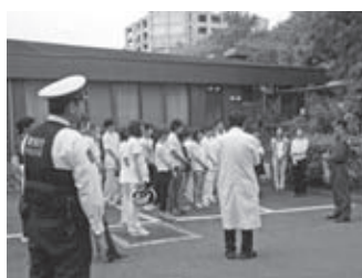
消化器の使い方のポイントは、『ピンポンパン』です。

※『ピン』で消火器のピンを抜き、『ポン』でホースを伸ばし、『パン』でレバーを握ります。