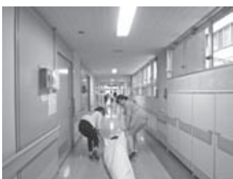
シーツ搬送の訓練

今後も実践的な訓練を定期的に行うことで職員一人一人の防災意識を高め、患者様の安全確保に努めてまいります。