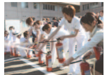
消火器の操作訓練