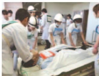
病状に応じて患者様を搬送する訓練

当院では、災害の際に患者様を無事に避難誘導できるよう、消防訓練を繰り返し実施しています。今回の訓練にも医師、看護師を始めコメディカル、事務スタッフなど多数参加し、玉川消防署の立ち会いのもと、「3階東病棟から出火した」という想定で、初期消火、消防署と各部署への通報、避難誘導訓練などに取り組みました。