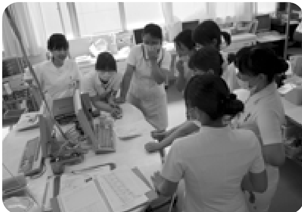
看護師の日々のカンファレンス