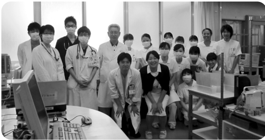
呼吸器内科の医師と共に

当病棟に入院されるすべての患者様に、最良の医療や看護を提供できるように、医療チーム一丸となって努めていきたいと思ひます。