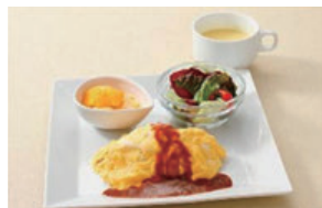
オムライスプレート