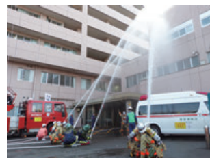
病院の自衛消防隊も消防隊、消防団と共に一斉放水