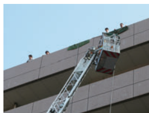
逃げ遅れた患者様を、はしご車で7階から救出