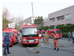
さまざまな隊が合同で演習を行った