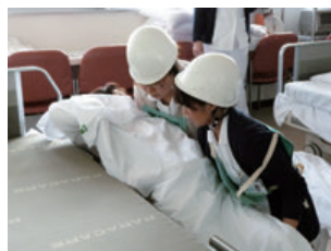
患者様の病状に応じて避難・誘導