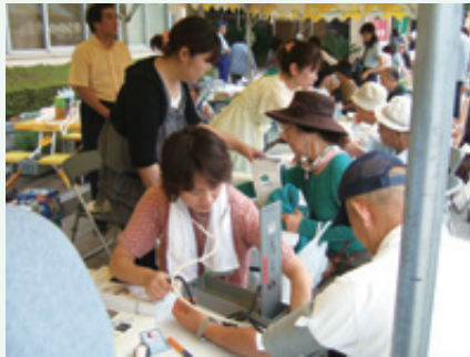
看護師による血压測定