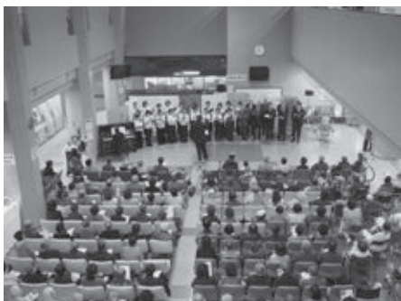
昨年のコンサート風景