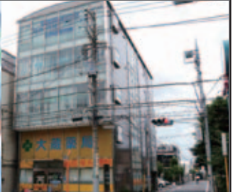
世田谷通り沿いのビルの5階です。エレベーターをご利用下さい。