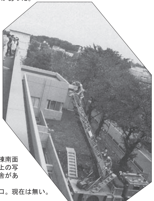
◀平成元年新病棟南面右下の辺りに上の写真の看護婦宿舎があった。左下は仮出入口。現在は無い。