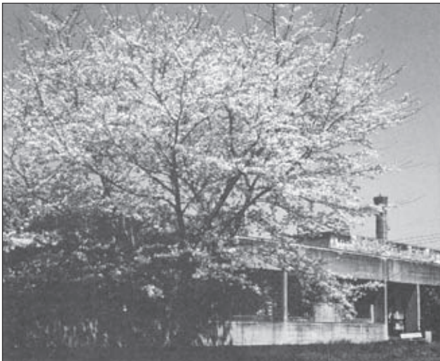
▲旧東1階病棟南側、新病棟着工直前（昭和62年3月）この辺りに右上写真の看護婦宿舎があった。

と、語気鋭く言ったそうです。その後、数人の若い男たちがどういう運命をたどったか、という興味深い謎は解けていません。